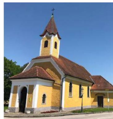
Maria Laab: Der Name soll für ein Marienbild im Laub stehen.

Marienkirche in Struden: Eine Sage berichtet, dass Kaiser Maximilian I. 1502 bei einer Übernachtung in seinem Schloss Werfenstein nur knapp dem Tod durch einen Deckeneinsturz entging. Als Dank für die Lebensrettung soll er eine gotische Marienkirche erbaut haben. Tatsächlich ist er laut einer Urkunde Stifter dieser Kirche. Er wollte den vorbeifahrenden Schiffsleuten die Gelegenheit geben, an Sonn- und Feiertagen hier eine heilige Messe hören zu können.