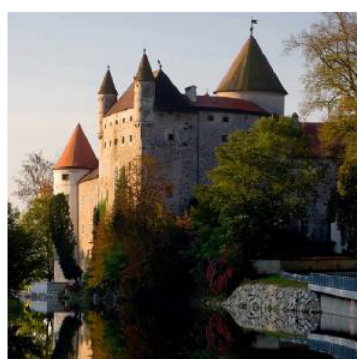
Schloss Schwertberg: Einst Raubritter-Sitz.

Die „Wilde Jagd“ in der Region: Ein gespenstischer Zug mit Hexen und Geistern, heulenden Hunden und wiehernenden Pferden soll einst großen Schreck erregt haben. Augenzeugen