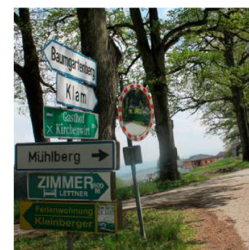
Die „Wilde Jagd“ tobte in diesem Kreuzungsbereich in Klam.

beschreiben auch Schüsse, Peitschenknallen und fürchterliches Geschrei. Für Zeugen soll der heidnische Brauch lebensgefährlich gewesen sein. Wer mitfahren wollte oder den Zug neugierig betrachtete, wurde getötet. Brot spielte als Schutz gegen Hexen und Teufel eine Rolle, weil es eine „Gottesgabe“ ist. Schützen konnte man sich auch, indem man das Gesicht